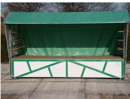
Abbildung Systemstand (Maße 4 x 2m., Ablagefläche 4 x 1,20m.)

Kosten für Reinigung, Absperrungen, Bauhof, etc. sind in der Standgebühr enthalten